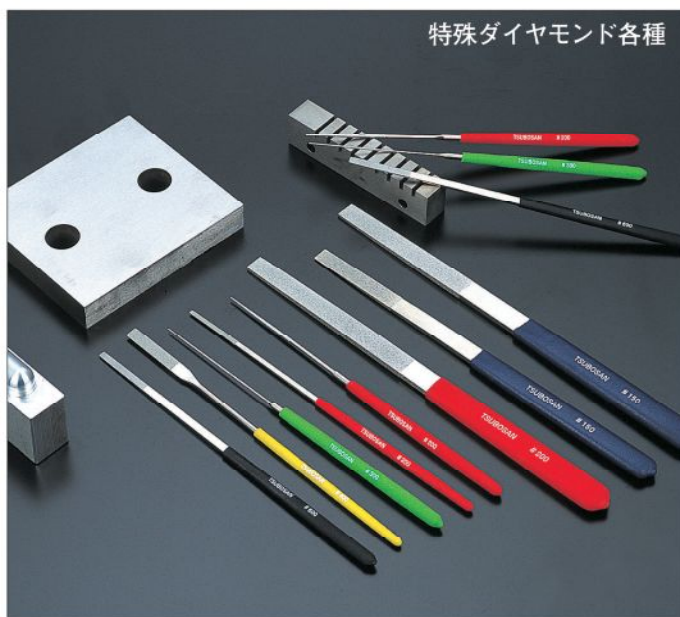
特殊ダイヤモンド各種